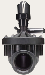
GSV200 / GSV201