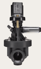
GSV100 / GSV101