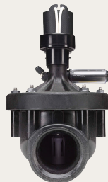
GSV200 / GSV201