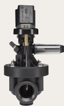
GSV100 / GSV101

Każdy model z serii GSV został zaprojektowany z myślą o długotrwałej eksploatacji oraz łatwej konserwacji i jest dostępny z gwintem NPT lub BSP.