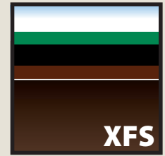
ليات تنقيط تحت سطحية