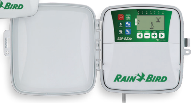
Modelo de exterior