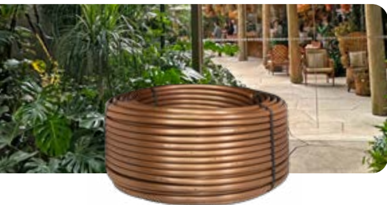
Ala gocciolante interrata XFS con tecnologia Copper Shield™

Il progetto presenta un'architettura paesaggistica diversificata che comprende "muri viventi", tetti verdi, una foresta pluviale interna unica nel suo genere e una torre con ampie terrazze di fitta vegetazione. Sostenibilità e flessibilità sono le priorità principali. Il sistema deve essere reattivo, quindi in grado di garantire un'irrigazione flessibile per ogni tipo di pianta nonostante le variazioni di sole, ombra e vento, senza impattare sull'architettura.