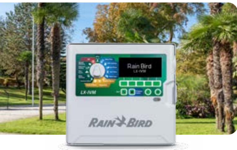
Programmatore a due fili ESP-LXIVM con tecnologia delle valvole intelligenti

L'aggiornamento del programmatore d'irrigazione e l'aggiunta di valvole intelligenti consentiranno di raggiungere l'obiettivo del parco di semplificare la manutenzione tramite una facile gestione remota da dispositivo mobile. La nuova tecnologia fornirà maggiori dettagli in merito allo stato di salute del sistema, poiché le valvole intelligenti comunicheranno con il programmatore e segnaleranno a quest'ultimo le proprie condizioni. Inoltre, l'installazione sarà più semplice, dato che verrà dimezzato il numero di giunzioni dei fili necessari.