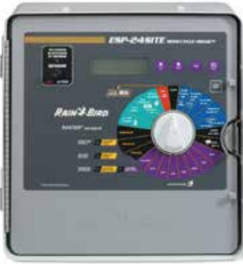
ESP-SITE-SAT Serisi Uydu Kontrolörü

Tatil yerinin çeşitli alanlarını yeterli şekilde sulamak için özel olarak tasarlanmış bir Rain Bird sistemi oluşturun. Daha önce Çin'de hiç kullanılmamış olsalar bile ıslah edilmiş suya dayanabilecek sağlam ticari sınıf bileşenleri dahil edin. Projenin tamamını güvenilir şekilde yönetmek için sezgisel bir kontrol sistemi kurun.